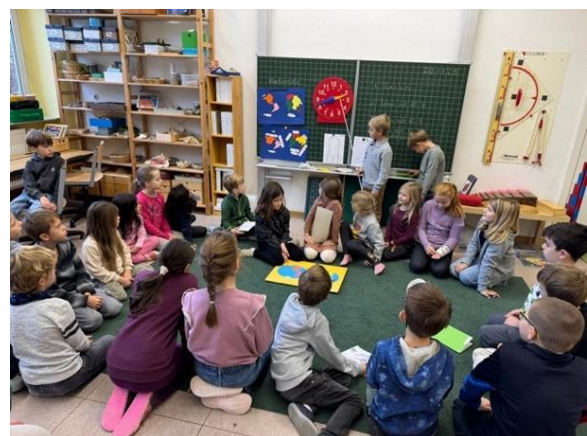
Abschlusskreis – lernen von anderen