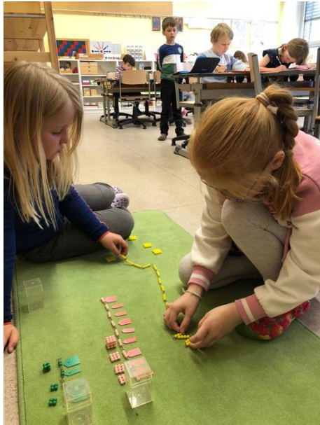
Impressionen aus der freien Arbeit