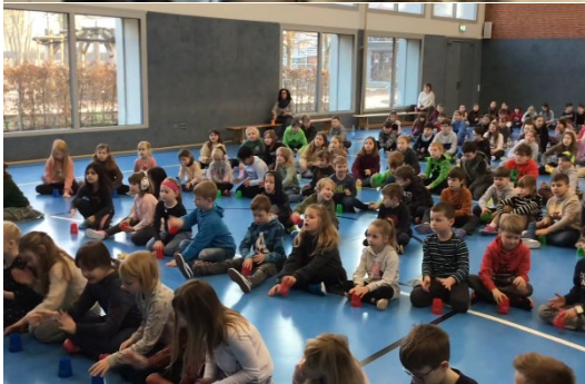
Die Kinder der Schule üben gemeinsam den „Cupsong“.