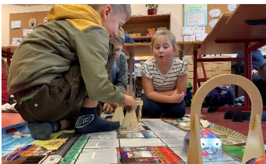
Kinder lösen Problemstellungen bei Challenges zum Programmieren mit dem Blusbot.