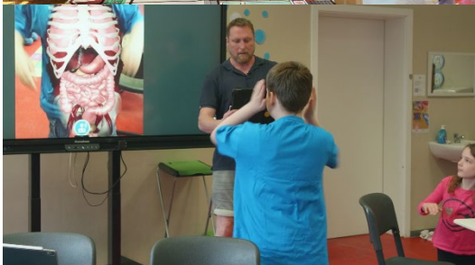
Mit Augmented Reality (AR) im Unterricht können immersive Lernerlebnisse generiert werden.