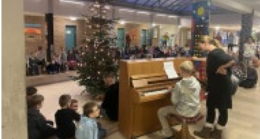
Beim Adventssingen begleitet uns ein Schüler am Klavier.