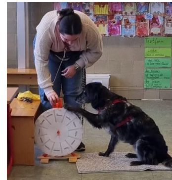
Schulhund Akira bei der Arbeit

Die Beratungslehrerin steht den Kindern zu festen Zeiten als Ansprechpartnerin zur Verfügung. Besonders Kinder mit traumatischen Erfahrungen oder erhöhtem Bedarf im emotional-sozialen Bereich erhalten hier einen geschützten Raum zur Entlastung, Stabilisierung und Beratung. Gleichzeitig profitieren auch Kolleginnen und Kollegen durch fachliche Unterstützung im Umgang mit belasteten Kindern.